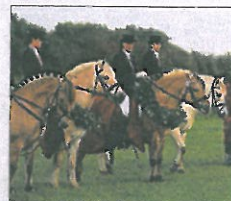
Ved sidste DM i Revsø, hvor afslutningen i øvrigt druknede i regn, var der egeløvs-kransen til vinderne, en særlig sønderjysk tradition.

ved sommerens mange stævner. Propositionerne kommer på nettet omkring den 1. juni. Kig på www.fjordhest.dk under "Sport", 2011. Her ligger også DM-reglementet, sammen med propositioner og resultater fra de øvrige fjordhestestævner, hvor Fjordhesten Danmark er samarbejdspartner. Rigtig god fornøjelse med træningen - vi glæder os til at se jer til DM!