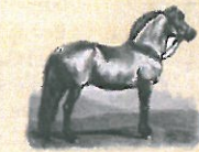
Anerkendte hingste 2012